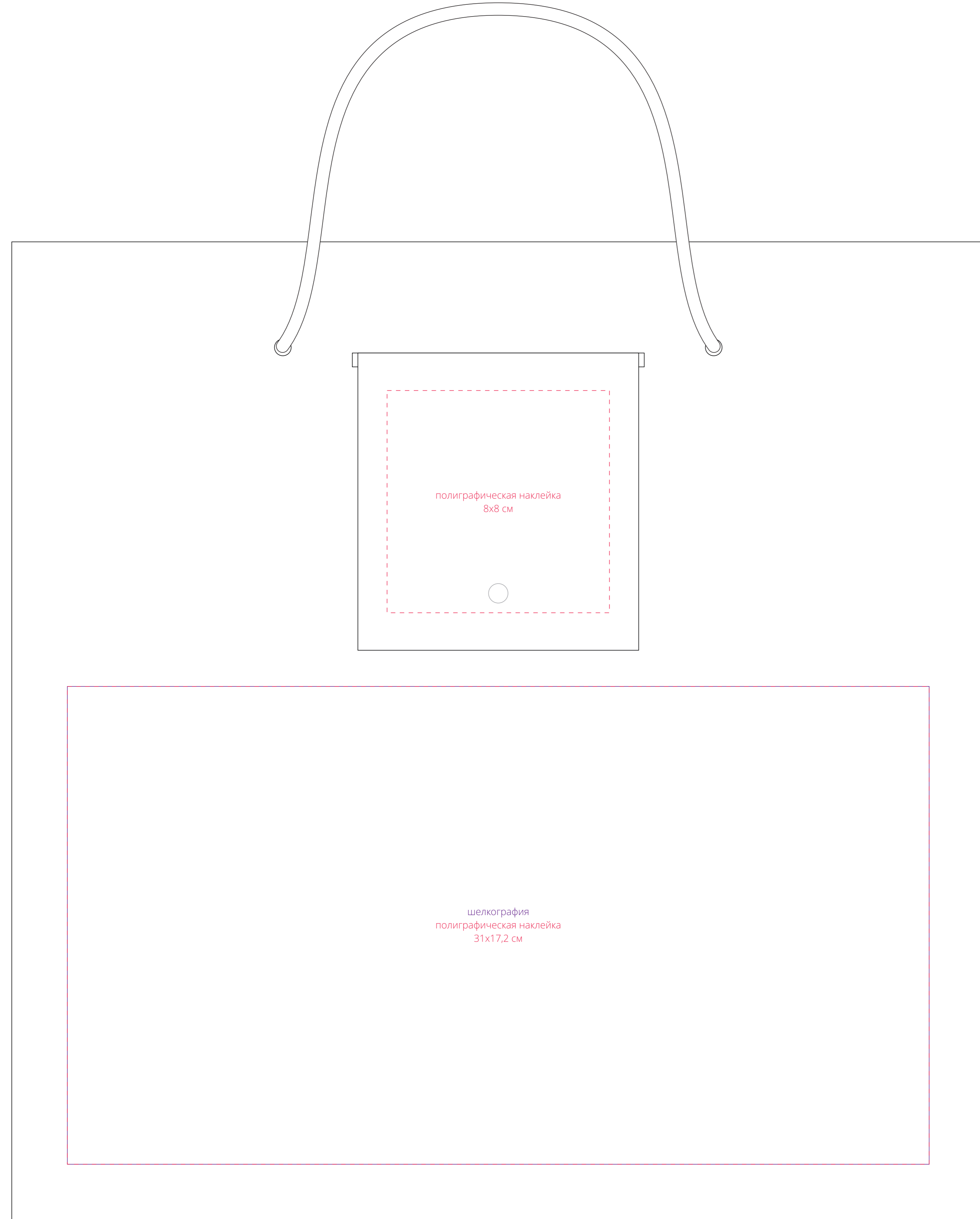
крышка (клапан с магнитом)